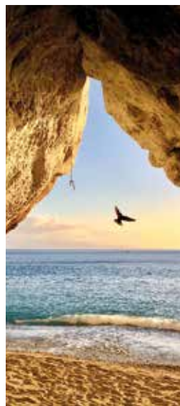
DAL CIELO E DAL MARE